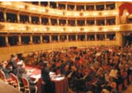
2006 award ceremony in the Ponchielli Theatre